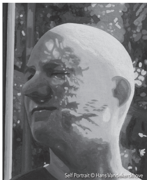
Self Portrait © Hans Vandekerckhove

Maak het ultieme zelfportret. Dat was kort en bondig de opdracht die Kristoff Tillieu en Lieve De Cuyper, galerijhouders van Black Swan Gallery (Langerei 24), aan een divers gezelschap van nationale en internationale kunstenaars meegaven. Het resultaat van deze introspectieve zoektocht is te zien in de boeiende expo 'Me, Myself and I' die plaatsvindt van 17 oktober tot 15 november.