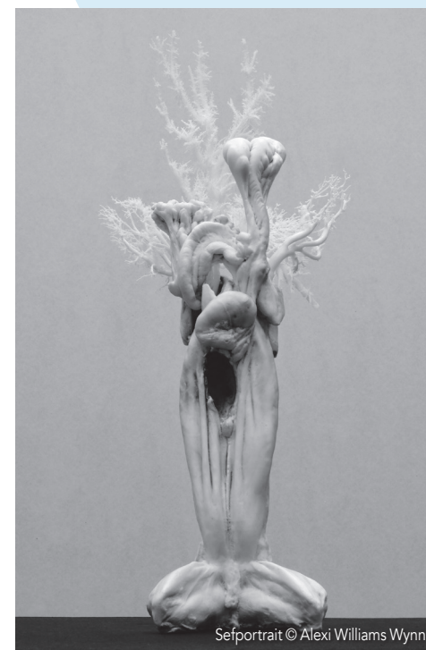
Selfportrait © Alexi Williams Wynn